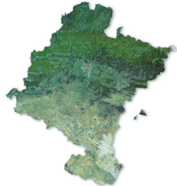
Navarra Digital Segura