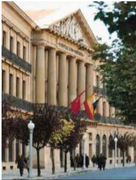
Plan de Seguridad Corporativo