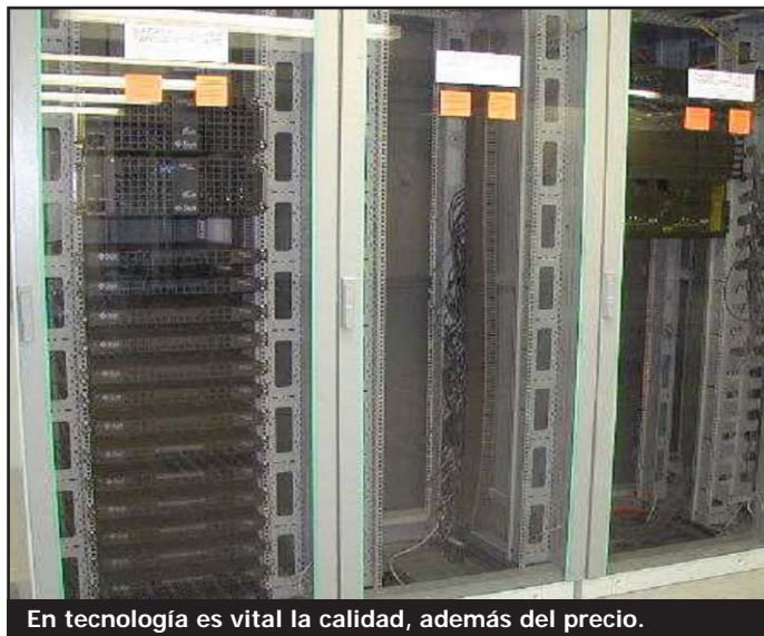
En tecnología es vital la calidad, además del precio.

la relación de trabajos incluidos en los distintos sub-grupos de clasificación, estableciendo y definiendo los trabajos incluidos en cada uno de los subgrupos de clasificación de los contratos de obras, como ya sucede con los de servicios, y revisando los incluidos en los subgrupos de clasificación de los contratos de servicios, al objeto de incorporar a la clasificación los cambios normativos o tecnológicos experimentados en algunas actividades, así como la experiencia acumulada en la gestión del sistema de clasificación.