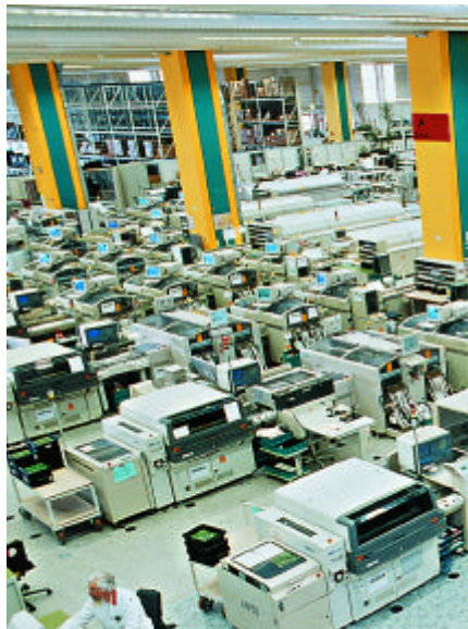
44. PC,s para las AA.PP.