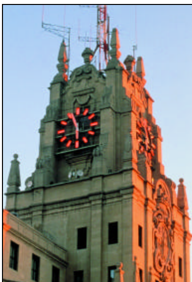
34. e-Government en España.